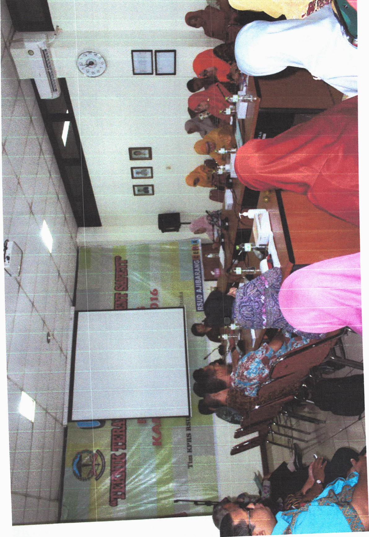
PEMBAHASAN DAN REVISI STANDAR PELAYANAN